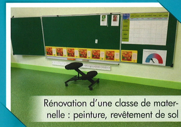
Rénovation d'une classe de maternelle : peinture, revêtement de sol

Une étude est en cours pour l'accessibilité de la mairie aux personnes handicapées.