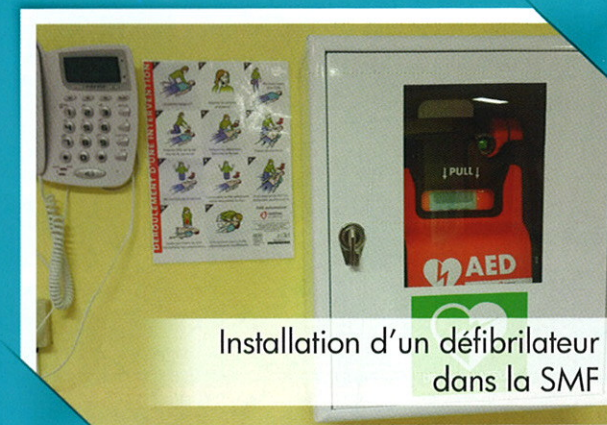
Installation d'un défibrillateur dans la SMF

Le haut débit couvre la totalité des habitations de notre village depuis 2016. Pour le moment seul SFR en a la commercialisation mais bientôt d'autres opérateurs pourront bénéficier du réseau.