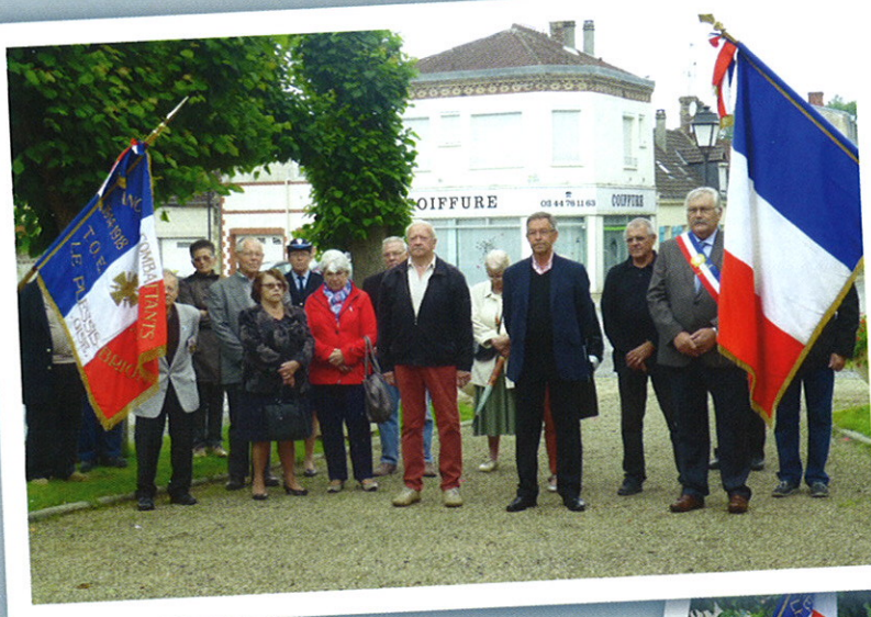
> 18 Juin Commémoration de l'appel du Général de Gaulle