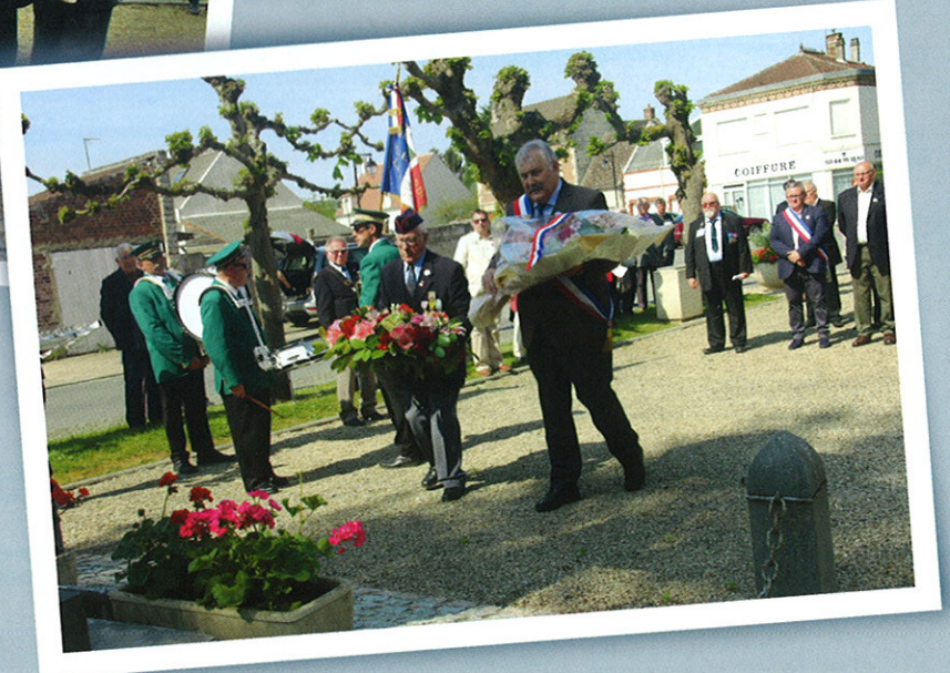
8 Mai < Dépôt de gerbes en commémoration de la fin de la seconde guerre mondiale