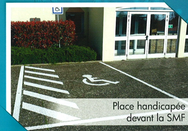
Place handicapée devant la SMF

Élagages, installations de grandes poubelles, diverses rénovations dans les écoles, dans l'église, ou à la salle multifonction, aménagement aux abords de la mairie