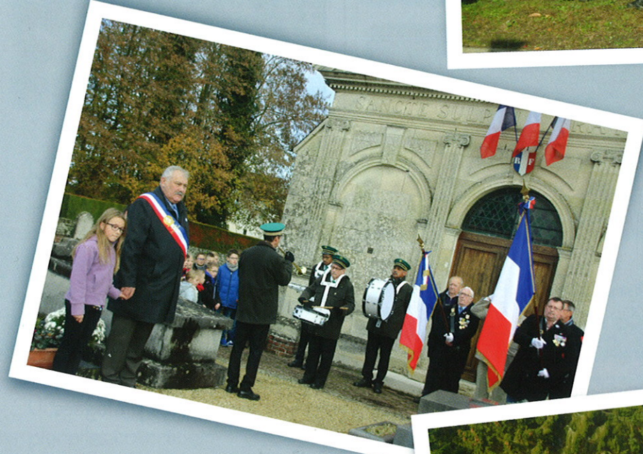
> 11 Novembre Moment de recueillement devant la tombe du soldat inconnu