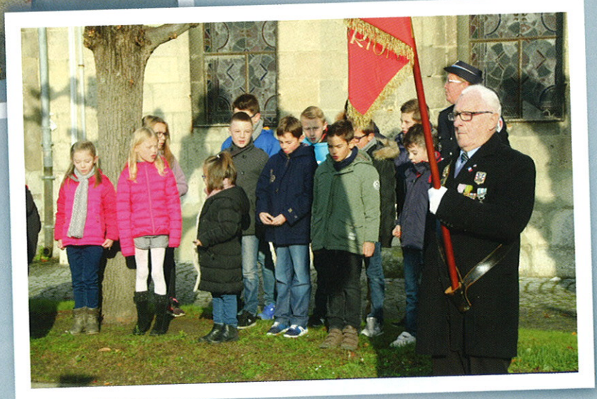
11 Novembre < Les enfants chantent la Marseillaise