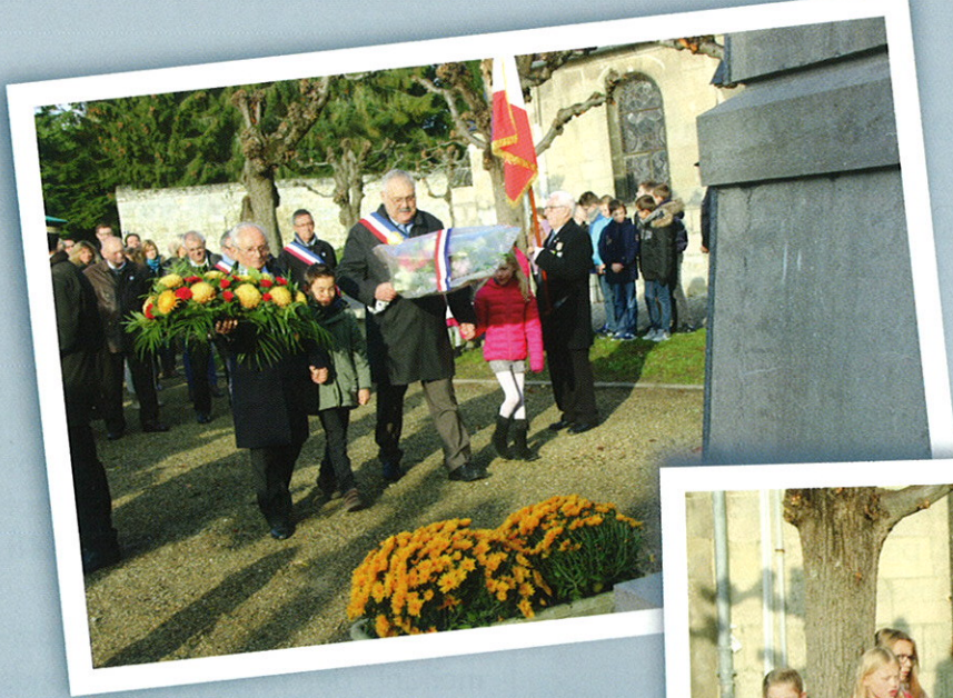
> 11 Novembre Dépôt de gerbes