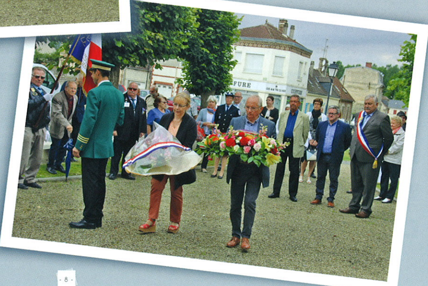
14 Juillet < Dépôt de gerbes pour la fête nationale