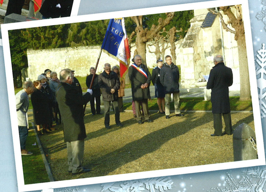
10 Décembre < Commémoration pour les anciens d'Afrique du Nord