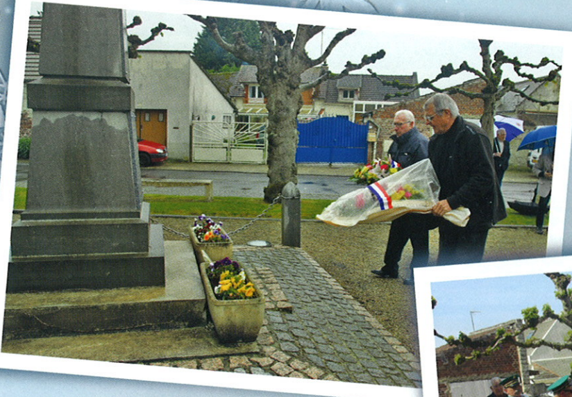
> 24 Avril Commémoration des déportés